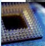
Microélectronique et Nanoélectronique