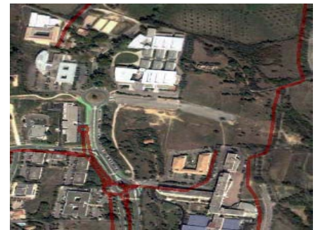
Technopôle de Château Gombert