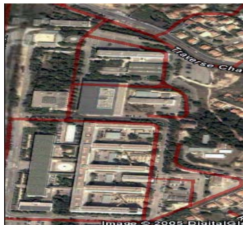
Campus de Saint Jérôme

Cet ensemble de laboratoires se situe sur le site de l'Etoile au Nord de Marseille qui inclut le campus de Saint Jérôme et le Technopôle de Château Gombert.