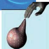
Traitement de l'Information et Systèmes